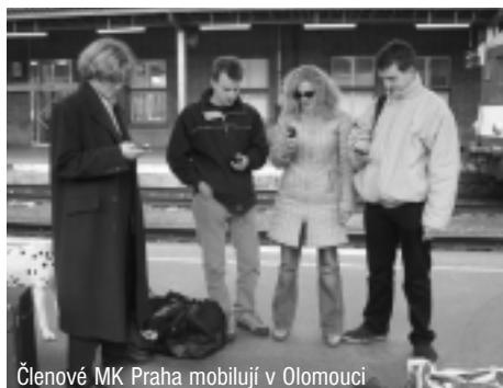
Členové MK Praha mobilují v Olomouci