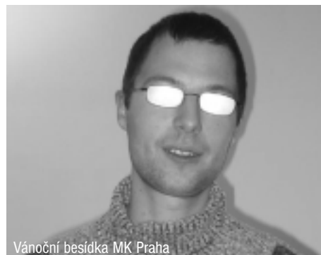
Vánoční besídka MK Praha

O naši lepší budoucnost se starají politikové, o lepší minulost historikové a o lepší přítomnost novináři.